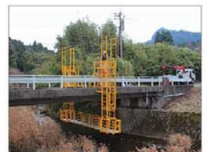
ブリッジハンガー