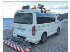
路面下空洞探査車